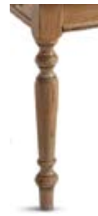
(1) gambe rotonde round-section legs pieds ronds abgerundete Beine Patas redondas