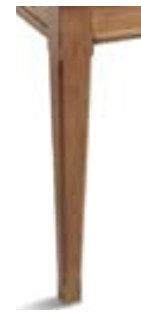
(2) gambe quadrate square-section legs pieds carrés viereckige Beine Patas cuadradas